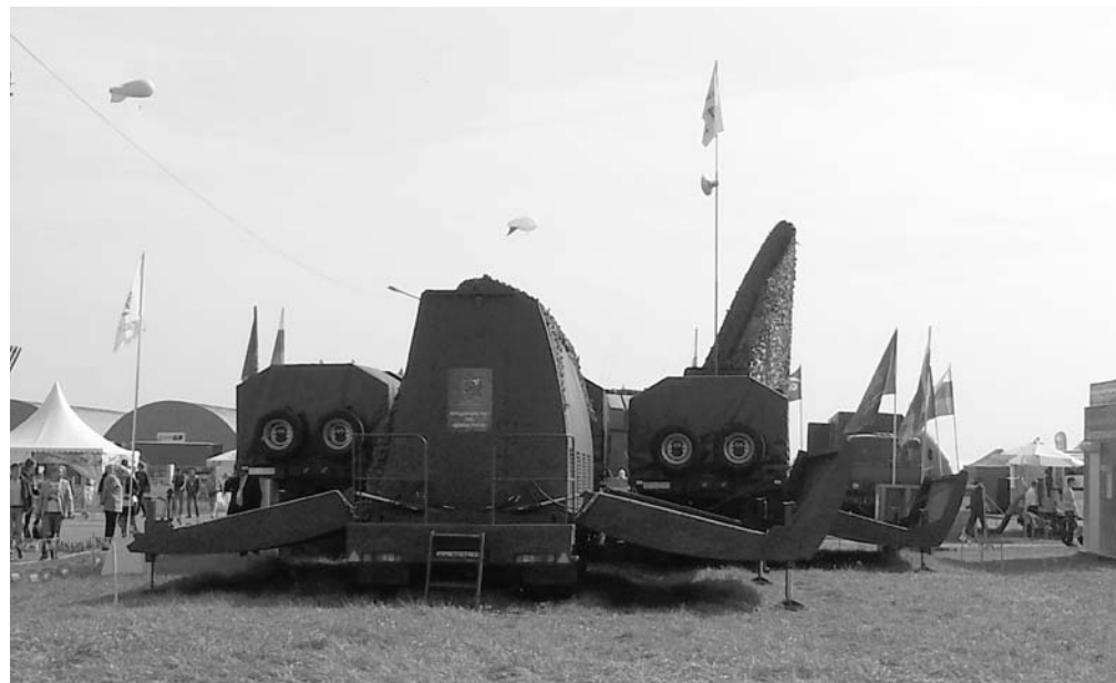
МС РЛС «Демонстратор» на выставке «МАКС — 2013»

Фактически это первая радиолокационная станция разработки ПАО «Радиофизика», которая является полностью цифровой и на прием, и на передачу. Оборудование станции, включающее командно-вычислительный пункт, пере-